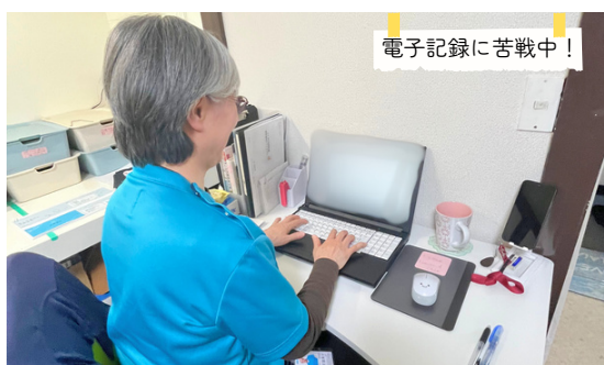
代表から「ペーパーレス!!!」を言われています（笑）